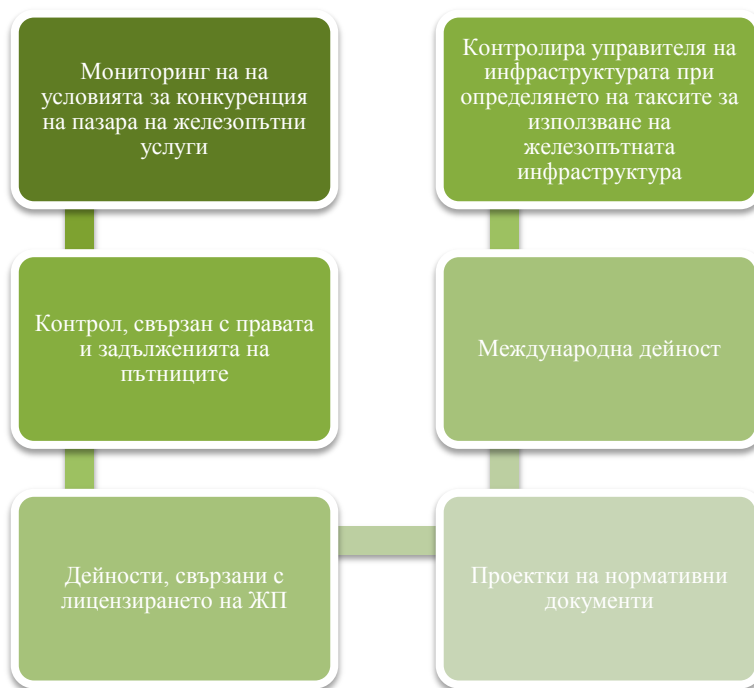
фигура 4 Дейности на дирекция "Регулиране" през 2018 г.

Основни направления на дейността на дирекция „Регулиране“ са представени графично на фигура 4.