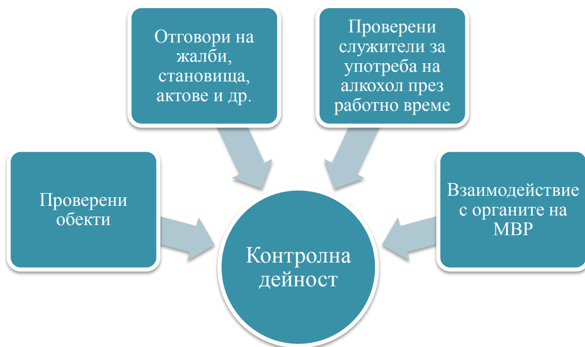
Фигура 6 Контролна дейност на ГДЖИ

Контролната дейност на Главна дирекция „Железопътна инспекция“ е показана на фигура 6 . Направленията са следните: проверка на обекти, отговор на жалби, становища актове и др., проверка на служители в железопътния транспорт за употреба на алкохол, както и взаимодействие с органите на Министерството на вътрешните работи.