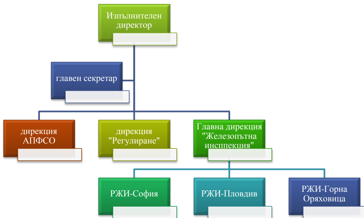
Фигура 1 Организационна структура на ИАЖА

Дейността на агенцията се извършва от обща и специализирана администрация, организирана в дирекции, както е показано на фигура 1 , която подпомага изпълнителния директор при осъществяване на правомощията му и осигурява техническата дейност и административното обслужване на физически и юридически лица.