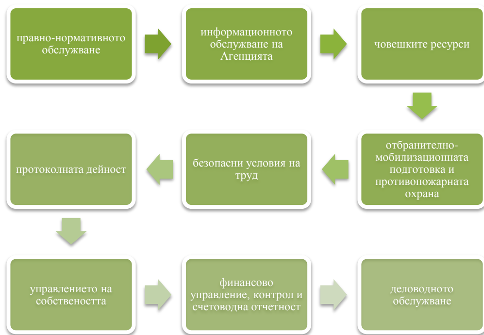
фигура 3 Дейности на дирекция АПФСО

Дирекция „Административно - правно и финансово-стопанско обслужване“ (АПФСО) изпълнява функции по техническото осигуряване на дейността на изпълнителния директор, на специализираната администрация и на териториалните звена към специализираната администрация и те са описани на фигура 3 .