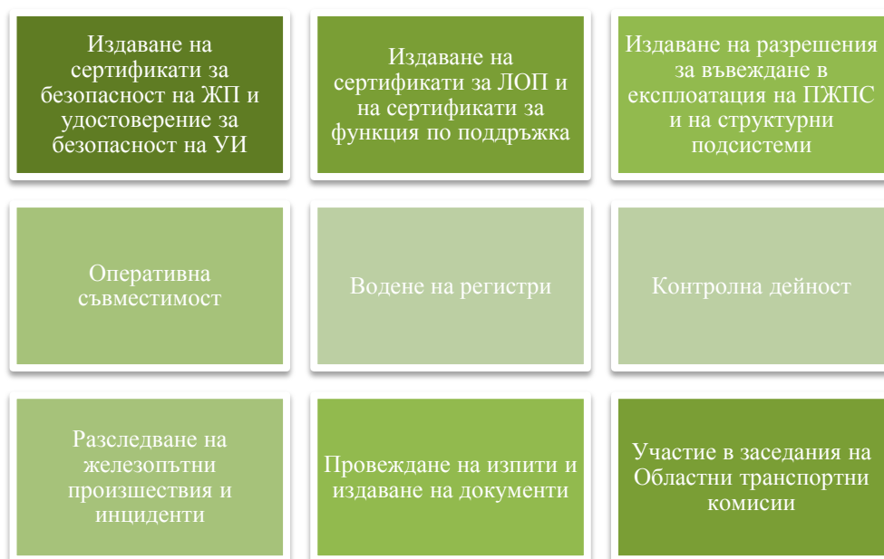
Фигура 5 Дейности на Главна дирекция "Железопътна инспекция" за 2018 г.

Основните направления на дейността на Главна дирекция „Железопътна инспекция“ са показани на фигура 5 .